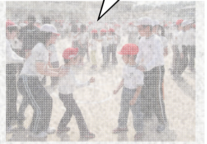
運営委員さんのスムーズな進行で…